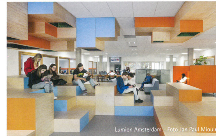
Lumion Amsterdam

In 2012 kregen wij de opdracht van zorgaanbieder WVO Zorg in Vlissingen om zes units te maken die afsluitbaar waren. In het Scheldekwartier, het voormalige terrein van Koninklijke Schelde Groep stond een beeldbepalend industrieel gebouw uit 1929. Het was een oude plaatwerkerij, waar stalen platen werden gesneden voor de wand van schepen. Het gebouw stond al lang leeg en de idee groeide om er een woonzorgfunctie aan te geven voor 50 somatische en 50 psychogeriatrische bewoners en 50 aanleunwoningen. Binnen en los van de bestaande structuur hebben we nieuwe units ontworpen. Op de begane grond situeerden wij het restaurant, er is een kapper, winkels, bibliotheek en les- en vergaderruimtes. Je vindt er ook een theater, dat door Filmhuis Vlissingen wordt gebruikt. Wanneer je een film of een expositie wilt bekijken moet je het bejaardenhuis in; het is voor iedereen vrij toegankelijk. Op de verdieping liggen de woningen voor de somatische bewoners. We hebben goed over de kamers nagedacht en alle indelingen in mock ups uitgetest om een vanzelfsprekend gevoel