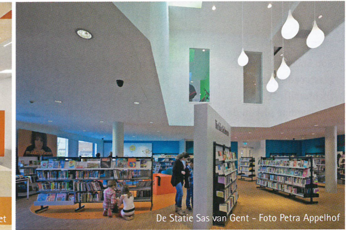
De Statie Sas van Gent

van huiselijkheid te creëren. Zo werken we met room dividers , zodat je in de kleine units niet direct op het bed kijkt maar het gevoel hebt dat je een woonkamer binnen komt. Zo zijn ook de installaties verticaal georganiseerd om optimale flexibiliteit en toekomstbestendigheid te waarborgen. Voor elke deur van een unit een herkenbaar voorwerp van de bewoner. Dat is voor dementerende mensen belangrijk; alleen met kleuren werken is niet voldoende. Een foto van het huis waar men ooit woonde, spullen en beelden die herinneren aan vroeger of de kinderen zorgen bijvoorbeeld voor de oriëntatie. Onderdeel van de interieuropdracht was om juist prullaria te kopen die in grote open kasten staan en herinneringen oproepen bij de bewoners en het gevoel van huiselijkheid en intimiteit geven. Vaak zijn inrichtingen in zorginstellingen esthetisch verantwoord, maar vreselijk saai en kleurloos. Voor de psycho-geriatrische bewoners hebben wij ook woningen rondom een wintertuin gemaakt. Hier hebben de patiënten de ruimte om te dwalen. Vanuit die tuin loop je een woning met een eigen keuken in, met daarachter een gang met de slaapkamers van de mensen. Elke woning heeft plaats voor acht bewoners. De gangen zijn breed en