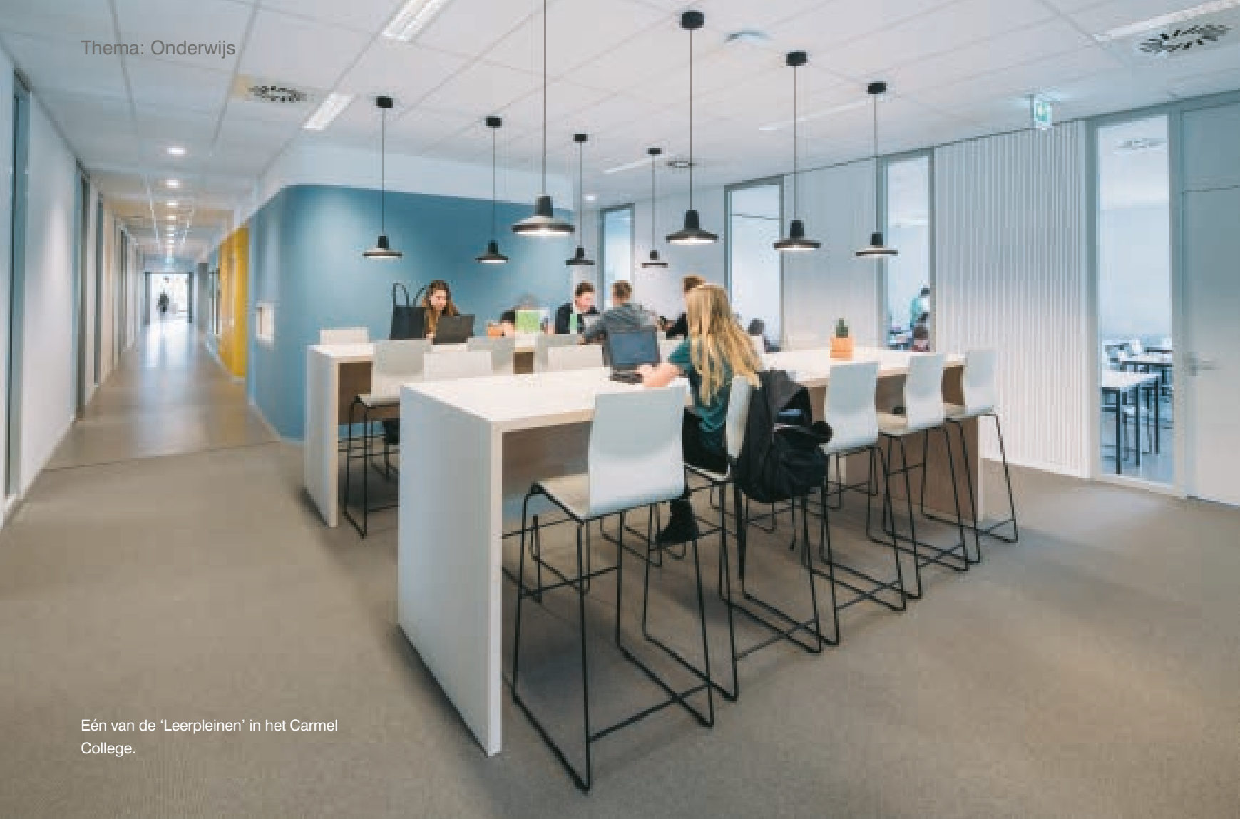
Eén van de 'Leerpleinen' in het Carmel College.

“Elk domein heeft zijn eigen kleur gekregen”