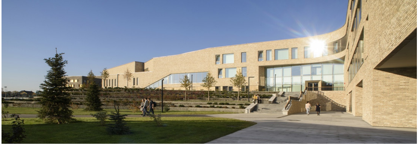
beeld: atelier pro