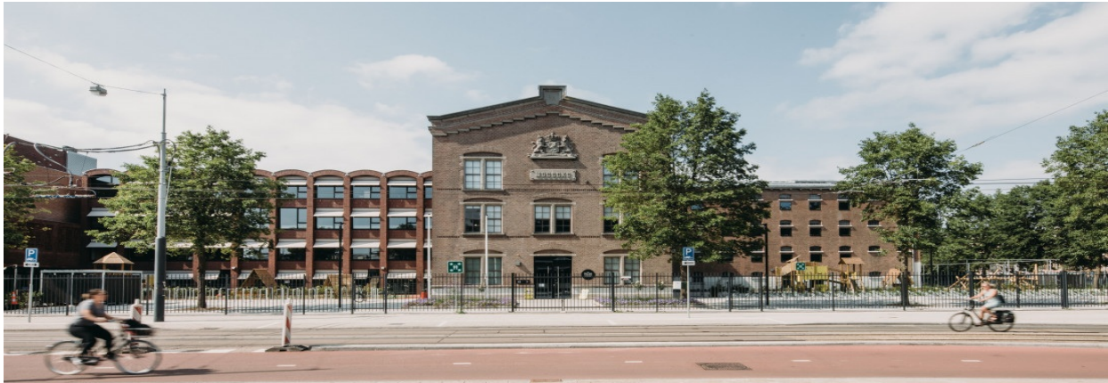
beeld: atelier pro