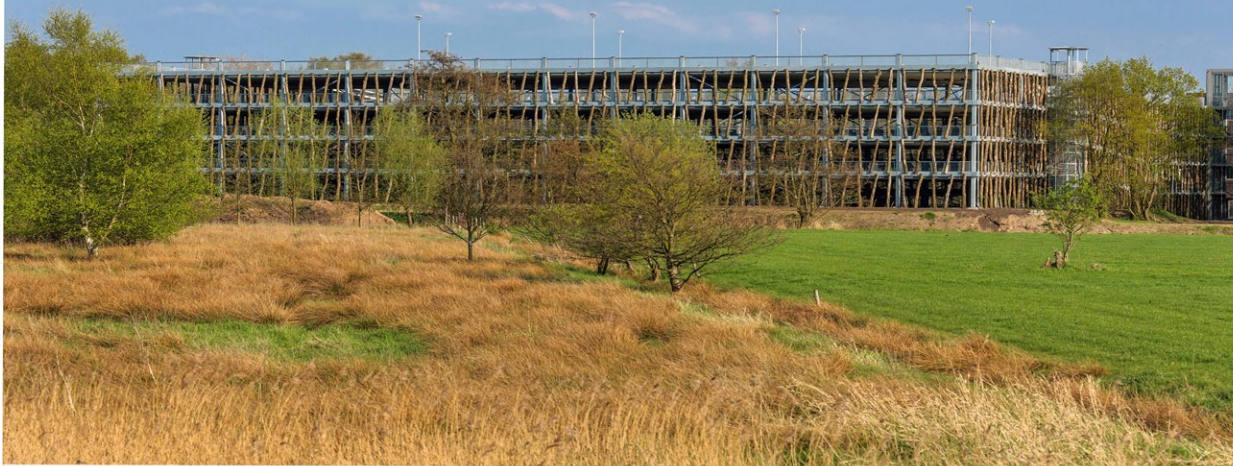
De parkeergarage moet schuil gaan achter stammen, klimop en wingerd. Naast het complex meandert het